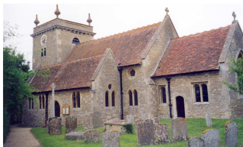
Het kerkgebouw van Stadhampton

Het zal onze zaligheid zijn altijd tot Hem op te zien, van Hem af te hangen, in Hem te geloven, op Hem te vertrouwen, en Hem geen rust te gunnen, totdat Hij telkens en telkens weer verschijnt tot blijdschap en vreugde des Harten.