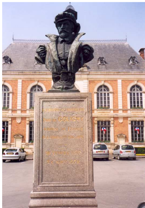
Hotel de Ville met Gaspard de Coligny

15.45 uur Museum van Châtillon Coligny, met informatie over de hugenotentijd en de geschiedenis erna.